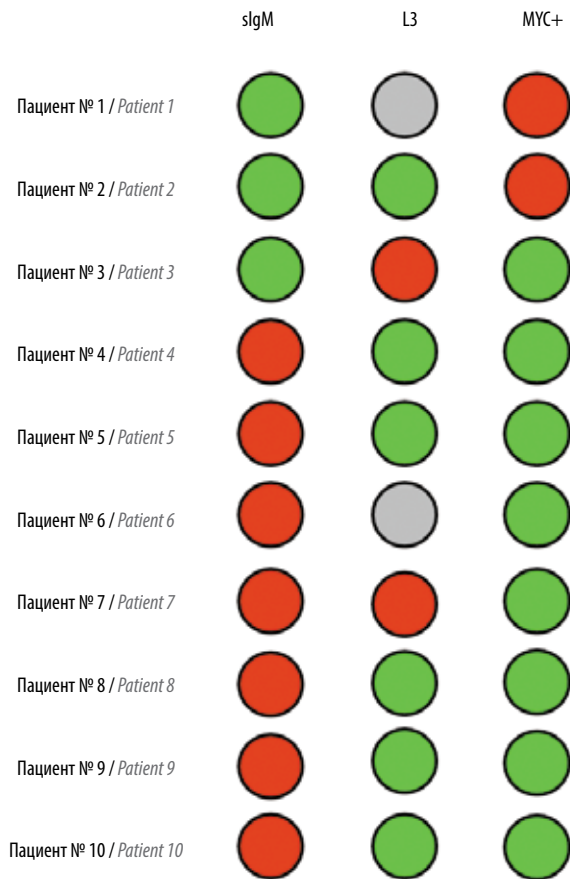
Рис. 1. Наличие (зеленый цвет) или отсутствие (красный цвет) данного лабораторного признака лимфомы Беркитта у 10 исследованных пациентов. Серым цветом обозначено отсутствие данных Fig. 1. Presence (green color) or absence (red color) of this laboratory Burkitt's lymphoma sign in 10 studied patients

В первых 2 случаях по результатам проведенного исследования FISH классические хромосомные